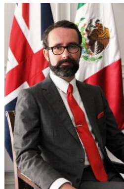
EMBAJADA DE MÉXICO EN REINO UNIDO

Estados Unidos. Desde pequeña ha gustado de apoyar a los demás, desde su familia, vecinos, comunidad, ha organizado radiotones, juguetones y uno de sus mayores logros como conductora ha sido recaudar fondos para operaciones de niños de escasos recursos. La vida, la percibe como una gran escuela donde todos somos alumnos y maestros al mismo tiempo.