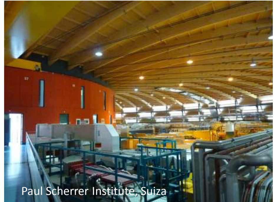
Paul Scherrer Institute, Suiza