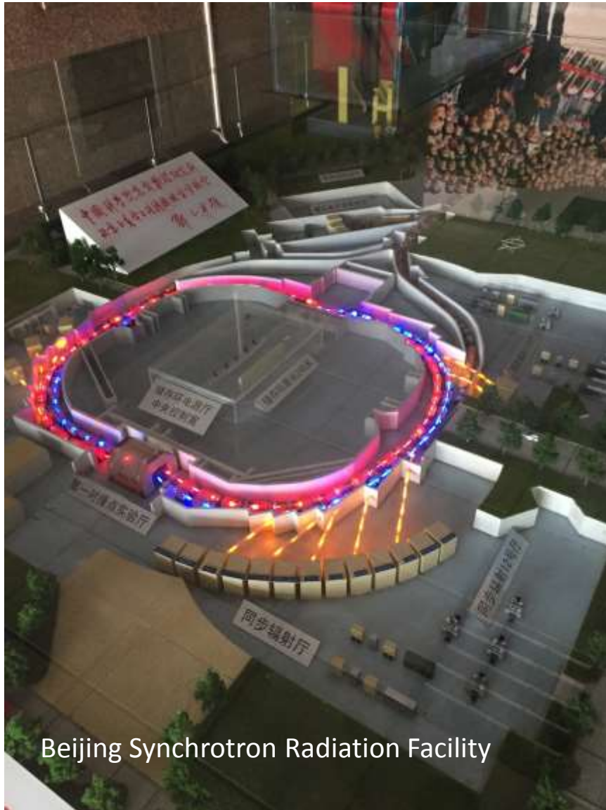
Beijing Synchrotron Radiation Facility