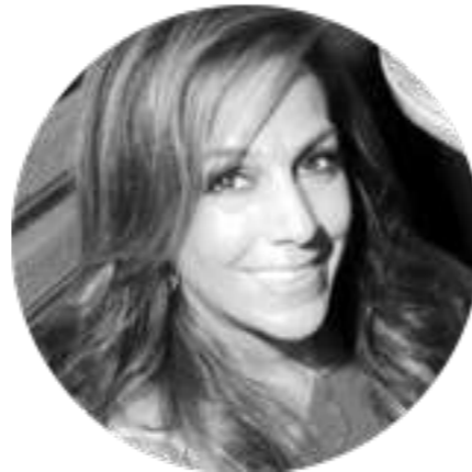
Jaye Galicot Ecosistemas de innovación